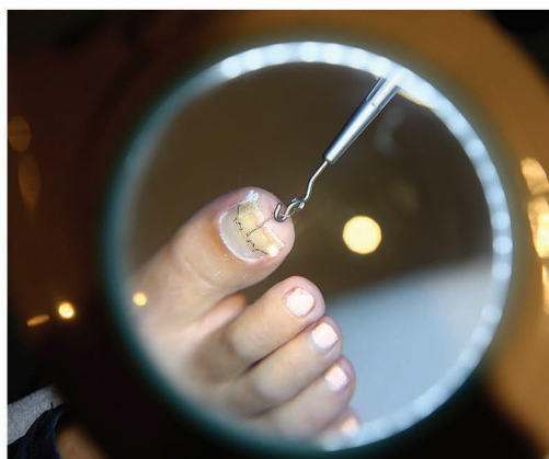
Vraščen noht in nameščanje VHO sponke.